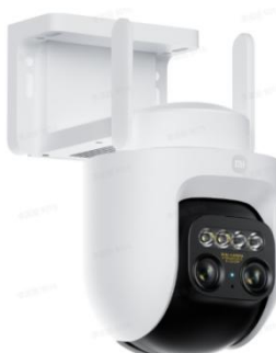
Immagine a colori del prodotto: