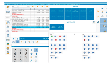
Soft Bar & Rest

Inglés, chino, euskera, castellano, catalán y portugués.