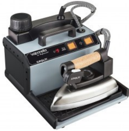
POLTI Vaporella 2H Professional