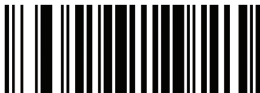
code 32 farmaceutico italiano NON ATTIVO

Per attivare la lettura del code 32 farmaceutico italiano basterà leggere dopo la prima attivazione il codice ATTIVO il barcode emetterà un bip di conferma. Adesso è pronto all'utilizzo.