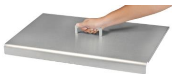
Deckel für Plancha-Grill Design simple (Bez. ACP6)