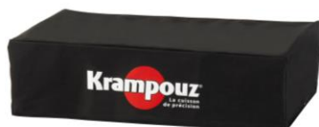
Schutzabdeckung für Plancha-Grill Design double (Bez. AHP2)