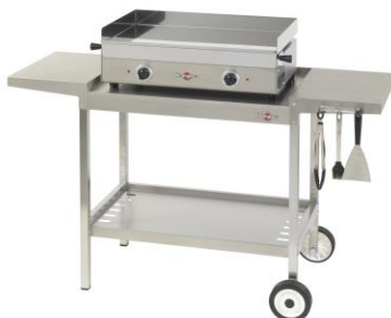
Carro plein air para la plancha Design doble (ref. Khea04)*