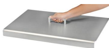
Cubierta para la plancha Design doble (Ref. ACP5)