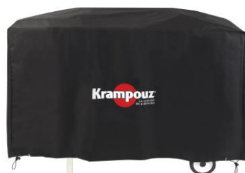
Funda para el carro Plein Air (Ref. AHC1)**