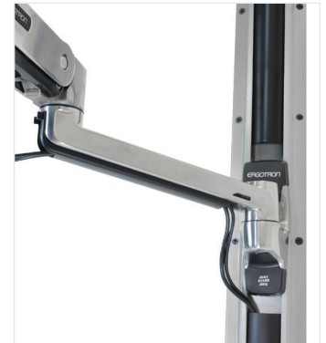
CONSEJO: FIJAR EL BRAZO EN UN RIEL DE PARED ERGOTRON (97-091)