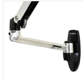
LA EXTENSIÓN LX INCREMENTA EL ALCANCE DE 23 CM. BLANCO (45-289-216) ALUMINIO PULIDO (45-289-026) NEGRO (45-289-224)